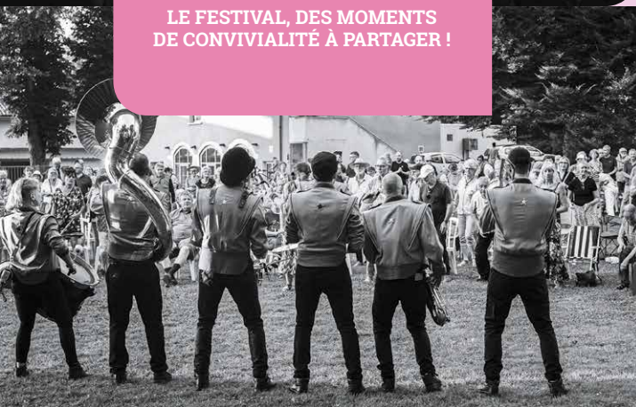
© Cuivres en Dombes - Vincent Béras Château Bouchet / 2024

LE FESTIVAL, DES MOMENTS DE CONVIVIALITÉ À PARTAGER !