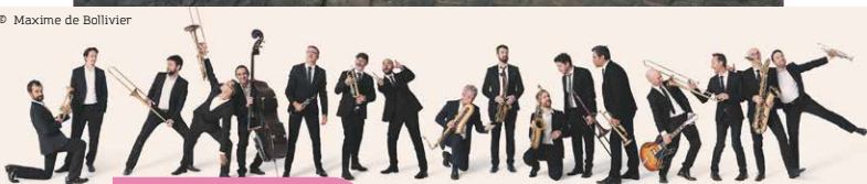
AMAZING KEYSTONE BIG BAND