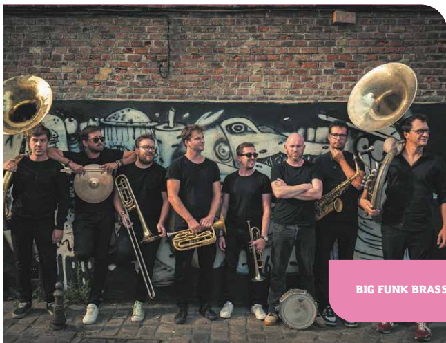
BIG FUNK BRASS