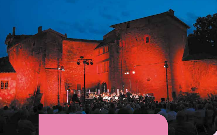
© Cuivres en Dombes - Perrine Gilbert Château de Glareins / 2022

LE FESTIVAL, DES MOMENTS DE CONVIVIALITÉ À PARTAGER !