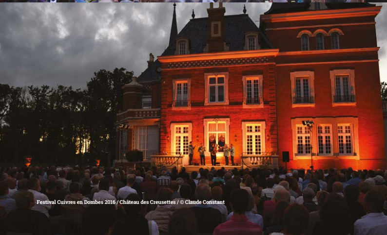
Festival Cuivres en Dombes 2016 / Château des Creusettes