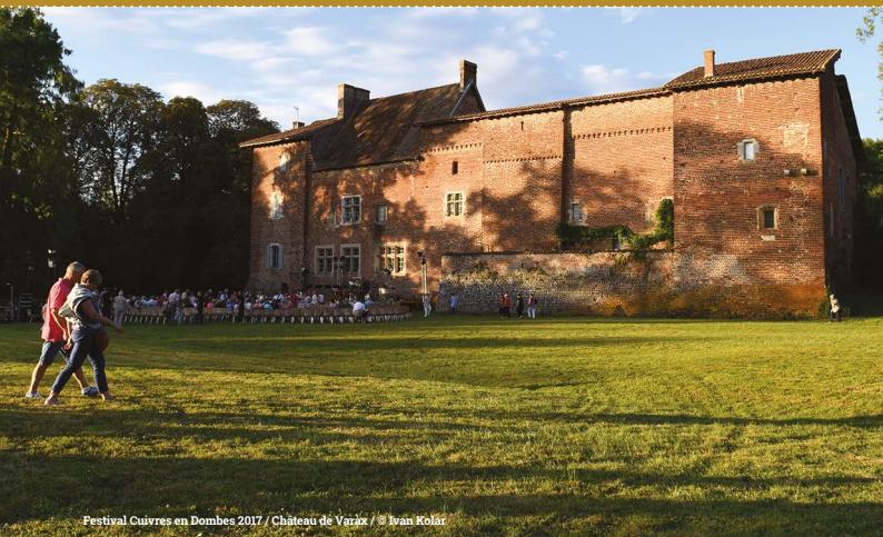
Festival Cuivres en Dombes 2017 / Château de Varax