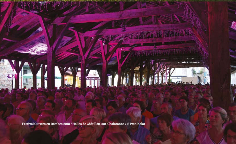
Festival Cuivres en Dombes 2018 / Halles de Châtillon-sur-Chalaronne