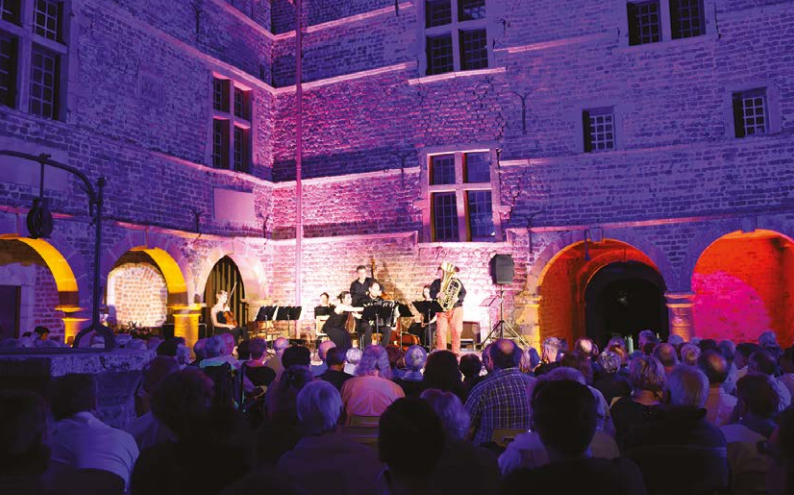
Festival Cuivres en Dombes 2016 / Château de Bouligneux