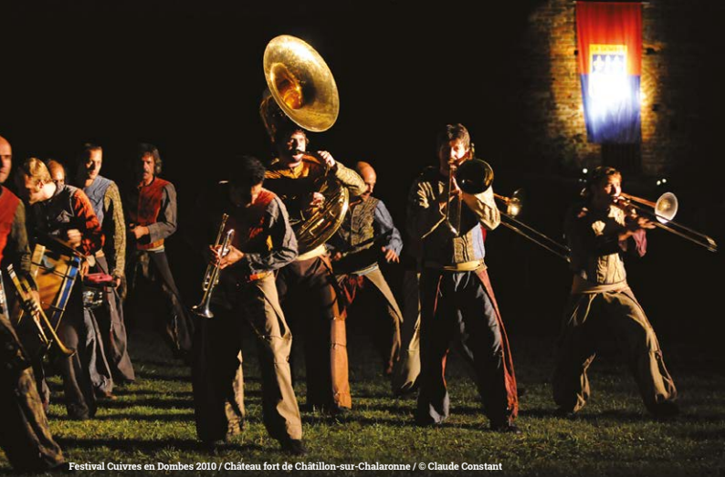
Festival Cuivres en Dombes 2010 / Château fort de Châtillon-sur-Chalaronne