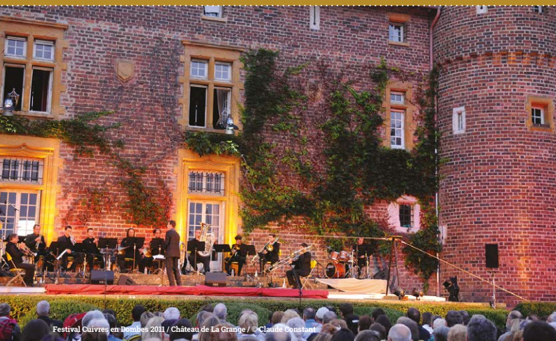
Festival Cuivres en Dombes 2011 / Château de La Grange